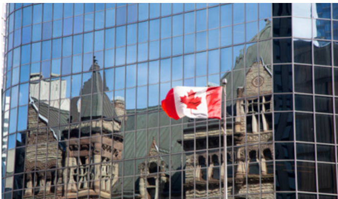
Imagen: Getty images

Explotación en minas y canteras | Cifras en millones de USD Fuente: Banco Central del Ecuador, Exponential Research